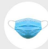
Masque de procédure

Le couvre-visage n'est PAS un équipement de protection approprié au travail. Il peut être porté par les travailleurs en supplément des mesures décrites ci-dessus.